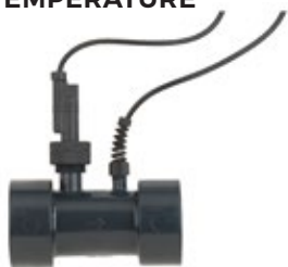
COMMUTATEUR DE DÉBIT ET CAPTEUR DE TEMPÉRATURE