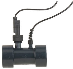
DURCHFLUSSSCHALTER UND TEMPERATURSENSOR